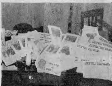
REQUISAN PROPAGANDA ROJA EN TURRIALBA. Nuestro Corresponsal en Turrialba informó que los comunistas están sumamente activos en aquella ciudad. Declaró que las autoridades han estado siguiendo la pista a varios agitadores comunistas, a algunos de los cuales les ocuparon una considerable cantidad de propaganda subversiva, parte de la cual aparece fotografiada en el cliché que reproducimos. Los poseedores fueron acusados judicialmente.