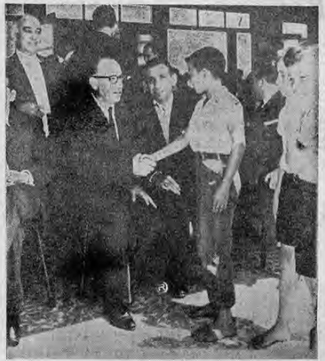
El señor Presidente de la República don Francisco J. Orlich, en compañía del Embajador de los Estados Unidos en Costa Rica Sr. Raymond Telles, recibe el saludo de niños humildes, alumnos de la Escuela Jorge Washington, de San Ramón. La escena que reproduce esta foto, expresión de la democracia costarricense, tuvo lugar el jueves pasado, después de que se verificó el acto oficial de inauguración de los trabajos de ampliación de la Escuela Normal de San Ramón, con auspicio del Programa de Alianza para el Progreso.